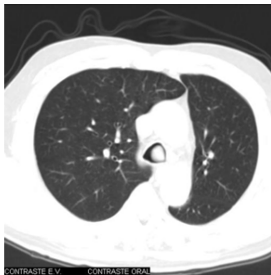
Figura 2 – Tomografia de tórax: obstrução traqueal pelo tumor.