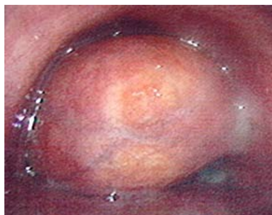
Figura 1 – Fibrobroncoscopia com extensa massa móvel e obstrução quase total no terço inferior da traquéia.

O exame histopatológico do material mostrou material amilóide característico, acelular, que se coloriu histoquimicamente pelo vermelho Congo (Figura 3). Nova fibrobroncoscopia evidenciou lesão residual em brônquio-fonte esquerdo, sendo encaminhado para retirada cirúrgica do restante da lesão pela possibilidade de recidiva tumoral a partir desse coto. Foi realizada ressecção segmentar