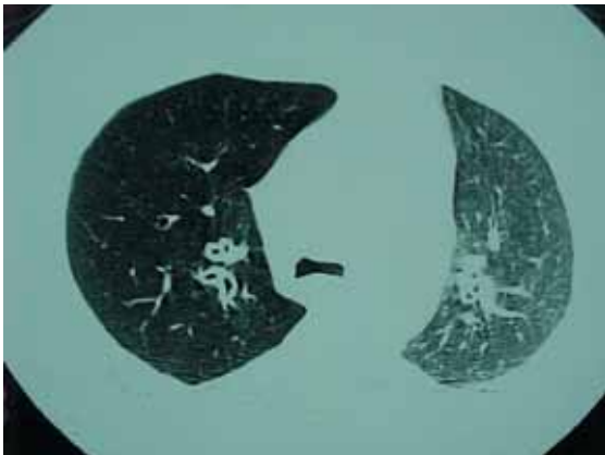
Figura 2 – Cortes tomográficos em expiração forçada demonstrando alçapamento de ar predominantemente no pulmão direito

O radiograma de tórax apresentava espessamento das paredes brônquicas. A tomografia computadorizada de tórax (26/02/2003) demonstrava espessamento importante da parede traqueal e de brônquios de maior calibre. Não havia evidência de alterações relevantes no parênquima pulmonar (Figura 1). Nos cortes em expiração forçada, foi demonstrado alçapamento de ar predominantemente no pulmão direito (Figura 2). Ecografia de abdome total e ecodopplercardiografia transtorácica estavam normais. Proteinograma sérico e biópsia de medula óssea apresentavam-se sem alterações. A tomografia computadorizada de tórax de controle, realizada em 19/03/2004, não evidenciou