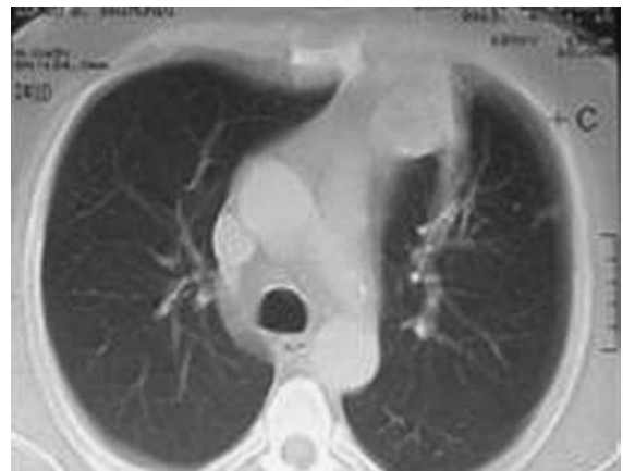
Figura 2 - Tomografia computadorizada de tórax.