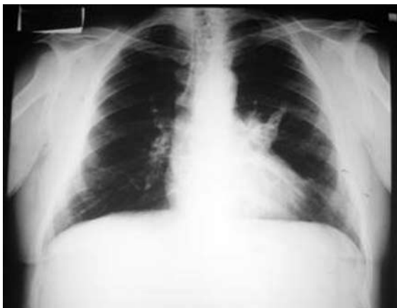
Figura 1 - Radiografia de tórax.

Na anatomopatologia, possuem componentes endodérmicos (tecido acinar pancreático, com ou sem ilhotas de Langerhans e epitélio respiratório), diferenciando-se dos sítios extra-torácicos. O teratoma intrapulmonar origina-se de células que podem se diferenciar em qualquer tecido do organismo. No caso relatado, a microscopia da peça operatória demonstrou tecido pancreático, cartilagem, osso, epiderme e glândulas sebáceas. (2,3) Sugere-se que o teratoma intrapulmonar deriva do tecido tímico do terceiro arco branquial. (2-6) Por outro lado, o teratoma mediastinal deriva-se do deslocamento e separação precoce do tecido tímico, durante a embriogênese, com a captura e migração dos primórdios do timo, durante o desenvolvimento do aparelho respiratório. (2)