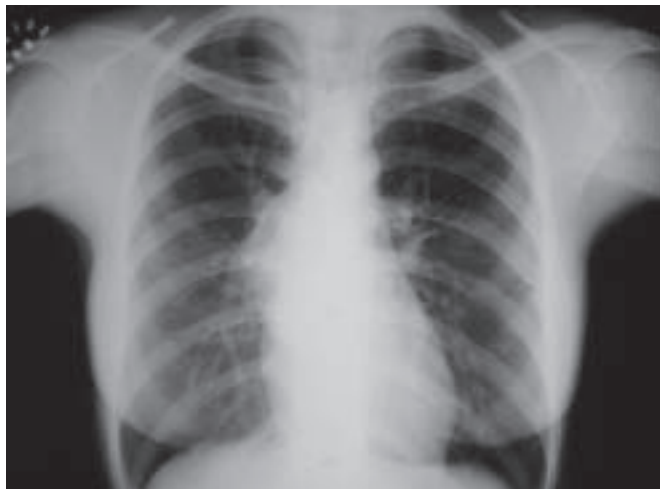
Figura 1 – Radiografia de tórax demonstrando massa mediastinal à direita

Solicitada tomografia computadorizada do tórax, a qual demonstrou a presença de lesão cística mediastinal pós-tero-inferior direita com conteúdo líquido medindo cerca de 8cm, estendendo-se desde a região subcarenal direita até a região retrocardíaca mediana junto ao átrio esquerdo, compatível com cisto mediastinal, tendo como hipótese cisto broncogênico ou de duplicação esofágica (Figura 3). A paciente foi, então, conduzida ao bloco cirúrgico para a realização de exérese de cisto broncogênico por videotoracoscopia. Foram realizados três portais de entrada, sendo o primeiro de 10mm no oitavo espaço intercostal na linha axilar posterior para a câmera, outro portal de 10mm no sexto espaço intercostal na linha axilar anterior e um terceiro de 5mm posterior à linha axilar posterior entre a escápula e a coluna vertebral para a manipulação de pinças.