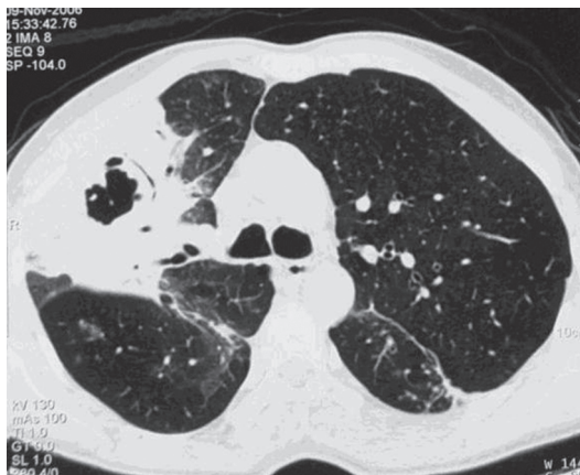
Figura 1 - TCAR, realizada em novembro de 2006, com corte no nível da carina, mostrando consolidação no lobo superior direito com cavitação de permeio.