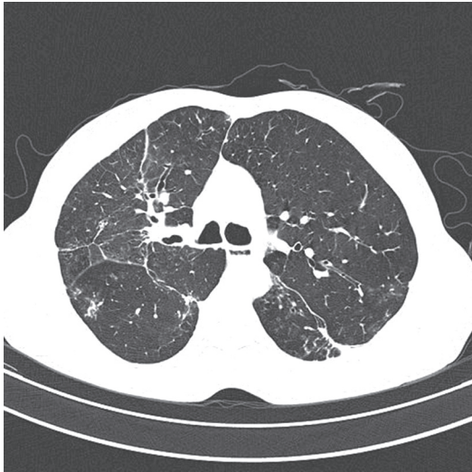
Figura 3 - TCAR, realizada como controle em dezembro de 2007, mostrando regressão total da consolidação com cavitação no lobo superior direito.

DPOC. Já entre as causas de redução da imunocompetência sistêmica, destacamos o uso de corticoterapia—mesmo em baixas doses—quimioterapia, radioterapia, etilismo, desnutrição e diabetes mellitus. (2-5) Casos de APNC são descritos também em pacientes imunocompetentes. (6)