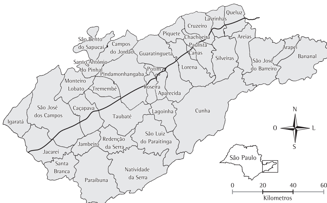
Figura 1 – Municípios do Vale do Paraíba (SP).

no primeiro quadrante, indicando alta prioridade na intervenção em virtude de terem altas taxas e de seus vizinhos também apresentarem altas taxas de internação por pneumonia. O diagrama de Moran determina a localização de cada município em um dos quatro quadrantes: quadrante 1, alto-alto, quando o município tem alta taxa e é cercado por municípios com altas taxas; quadrante 2, -baixo-baixo, quando o município tem taxa baixa e é cercado por municípios com baixas taxas; quadrante 3, alto-baixo, quando o município tem alta taxa e é cercado por municípios com baixas taxas; e quadrante 4, baixo-alto, quando o município tem baixa taxa e é cercado por municípios com altas taxas.